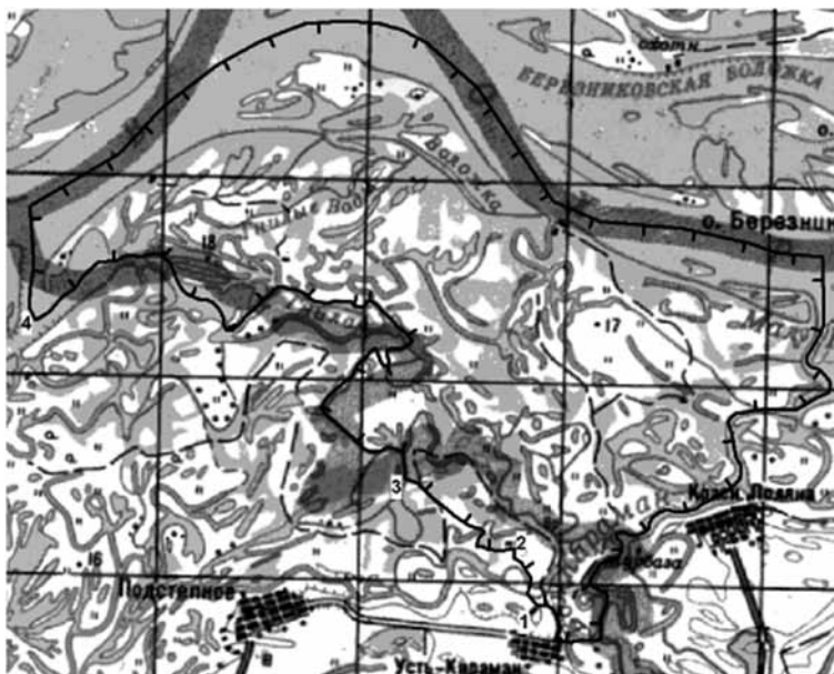
Карта-схема участка общедоступных охотничьих угодий «Черные Воды» Марковского и Энгельсского районов

западная граница: по среднему течению р.Гнилой, огибая Луйские луга с севера, до Прорвинского затона, по срединной линии Прорвинского затона до р.Волги (2118 км основного судового хода).